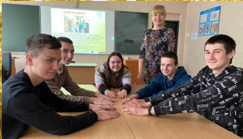
Будинг: не мовчи!

Подивись наліво, подивись направо- там моя професія престижна і цікава