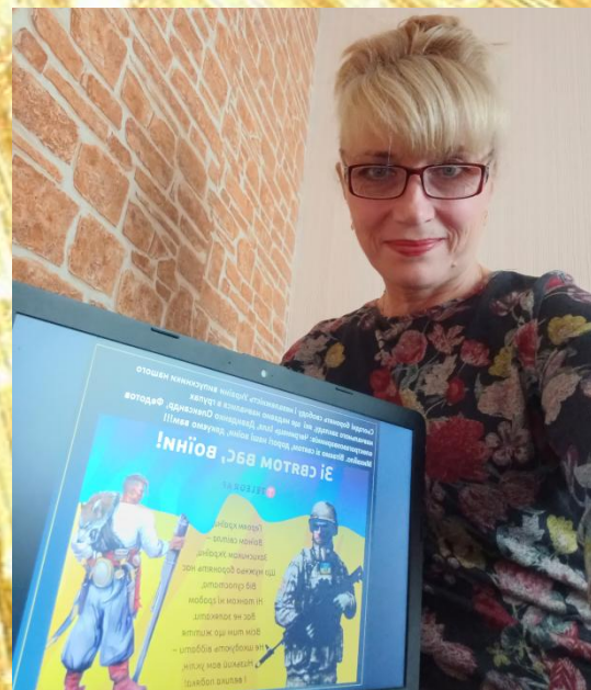
14 жовтня- день захисників і захисниць України